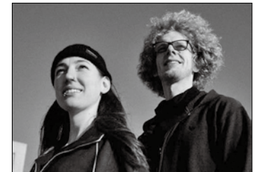
Eröffnet heute Abend den Plattdeutschen Monat auf Norderney: Die Tüdelband.

milienprogramm bereit. So spielt das Puppentheater Rumpelkiste am 13. September das Stück „Kasper's Ferienabenteuer“ und am 15. September die Geschichte „Gertrud von Gans“. Auch eine kindgerechte Museumsführung durch das Fischerhaus ist für den 20. September geplant. Weitere Details zu den Veranstaltungen gibt es online unter www.norderney.de .