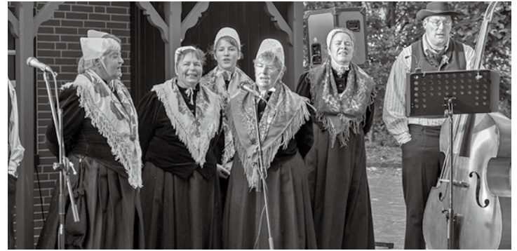
Die Spielschar des Heimatvereins wird zum morgigen Fest am Fischerhausmuseum für die musikalische Unterhaltung sorgen.