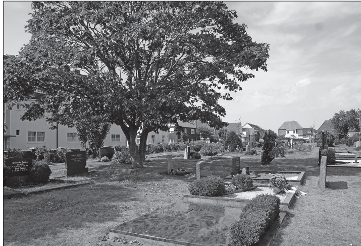
Ab September soll der Friedhof durch die NABU-Ortsgruppe mit Quartier- und Nisthilfen ausgestattet werden.

Norderney – Die Niedersächsische Bingo-Umweltstiftung unterstützt das Projekt „Biodiversität auf dem Norderneyer Friedhof“ bei der Installation von Nist- und Quartierhilfen. Dies gab die Norderneyer Ortsgruppe des Naturschutzbund (NABU) in einer Pressemitteilung bekannt.