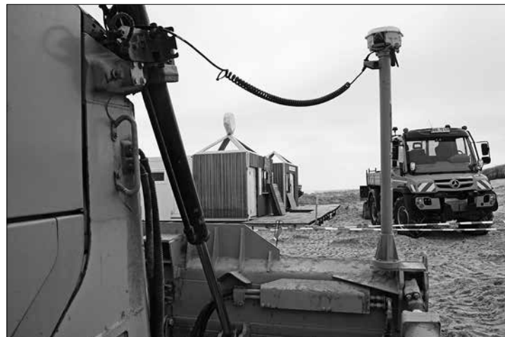
Die ersten Ergebnisse der Sandverlegungen zur Weißen Düne sind bereits gut sichtbar.