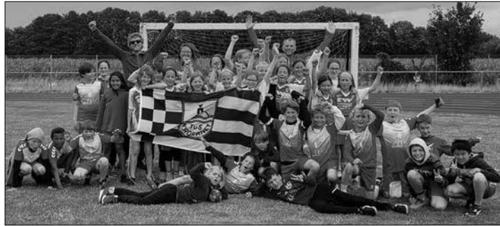
Der Handballnachwuchs der Insel nahm am Wochenende am 44. Internationalen Handballturnier teil.

Norderney - 36 Mädchen und Jungen der TuS-Handballsparte nahmen am vergangenen Wochenende beim 44. Internationale Handballturnier des BV Garrel teil. Vier Mannschaften der weiblichen und männlichen E- sowie D-Jugend gingen in das Turnier, dabei galten für die Begegnungen bereits die Jahrgänge der im September beginnenden Wettkampfsaison, wodurch sich die beiden D-Jugend-