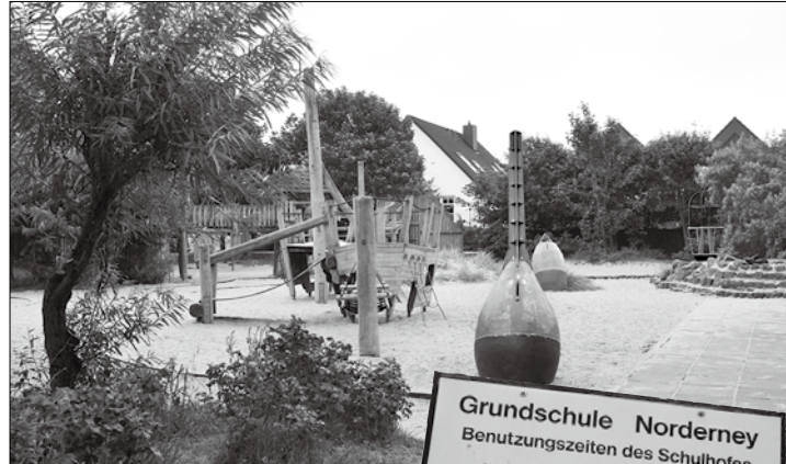
Besonders nach Partywochenenden werden Müll und Fäkalien auf den Schulhöfen der Grundschule gefunden.