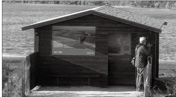
Die NABU-Beobachtungshütte am Südstrandpolder steht wieder zur wind- und wettergeschützten Vogelbeobachtung zur Verfügung.