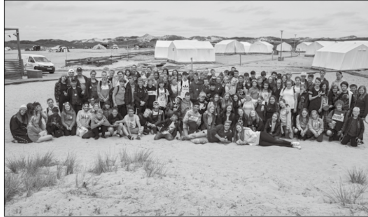
Zu den drei Zeltfreizeiten des Landkreises Aurich kamen zahlreiche Kinder und Jugendliche nach Norderney.