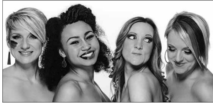
Die Dresdner A-Cappella-Gruppe „Medlz“ spielt heute im Kurtheater

Norderney - Wie schön die deutsche Sprache sein kann, will die A-Cappella-Gruppe „Medlz“ aus Dresden heute mit ihrem neuen Programm „Heimspiel“ im Kurtheater zeigen. Dazu lassen sie alte Schlager der Wirtschaftswunderzeit aufleben und singen Schillers „Ode an die Freude“ oder Hits von den