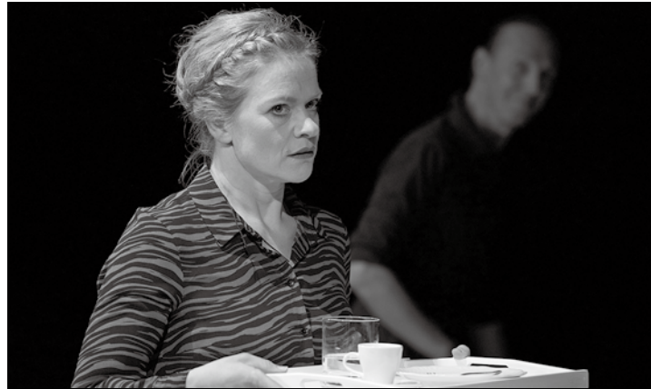
Ein Theaterstück mit bitterbösem Verlauf: „Der Gott des Gemetzels“

Norderney – Die Landesbühne Nord führt heute im Kurtheater das Theaterstück „Der Gott des Gemetzels“ auf. Die zeitgenössische Boulevardsatire von Autorin Yasmina Reza wurde 2011 erfolgreich von Roman Polanski verfilmt und nimmt die Gepflogenheiten und Sitten der gutbürgerlichen Bildungsschicht tiefschwarze, bissige und humorvolle aufs Korn. Dabei werden nicht nur die Scheinheiligkeit und linksliberale Sozialkritik entlarvt, sondern auch die scheinheiligen Fassaden von Ehe, Status und Familie.