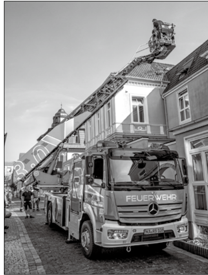
Am Mittwoch testete die Norderneyer Feuerwehr ein neues Drehleiterfahrzeug.

(syk) – Dass das jetzige Drehleiterfahrzeug der Feuerwehr aufgrund immer wiederkehrender Mängel durch ein neues ausgetauscht werden muss, wurde bei der Sitzung des Ausschusses für Wirtschaft, Tourismus und Verkehr im April erörtert. Die Feuer-