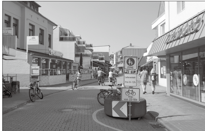
Ab morgen darf wieder geradelt werden in der Jann-Berghaus-Straße.