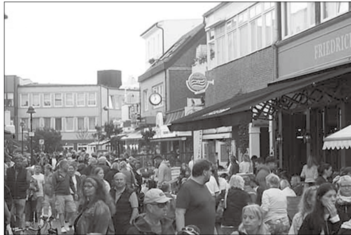
Die Geschäfte der Friedrichstraße laden heute Abend ab 18 Uhr zum Stöbern und Nachtschwärmen ein.

Norderney/dol – Gleich zwei Veranstaltungen gibt es heute Abend in den Straßen der Norderneyer Innenstadt zu erleben.