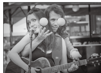
Heute und morgen zeigen außerdem die Straßenkünstler der Agentur Zeitenwanderer in der Poststraße ihr Können.

Wenige Straßenecken weiter in der Poststraße findet heute und morgen außerdem ein Straßenkunstfestival statt,