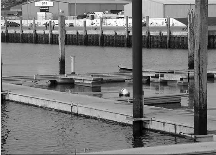
Die Anlage wird während der Sturmflutseason abgebaut.