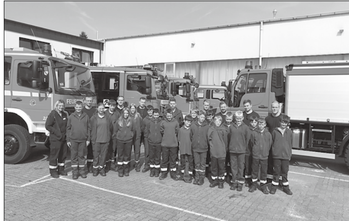
Eine Woche lang war die Jugendfeuerwehr im Zeltlager im Teutoburger Wald.