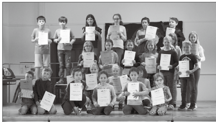
Applaus bekamen auch die Teilnehmer des Vorlesewettbewerbs.