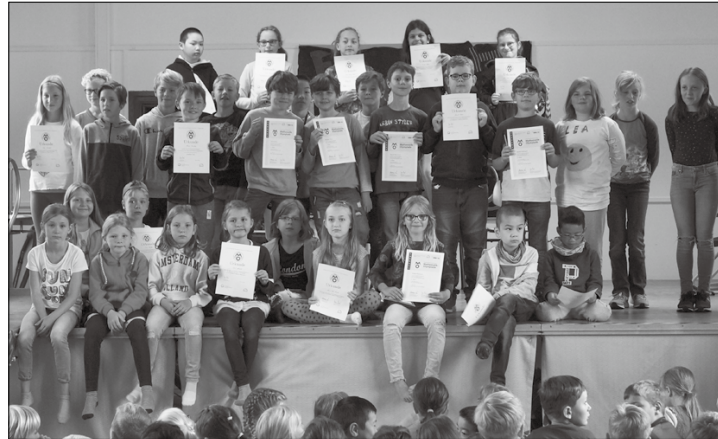
Die Teilnehmer der 58. Mathematik-Olympiade bekamen gestern viel Applaus von ihren Mitschülern.