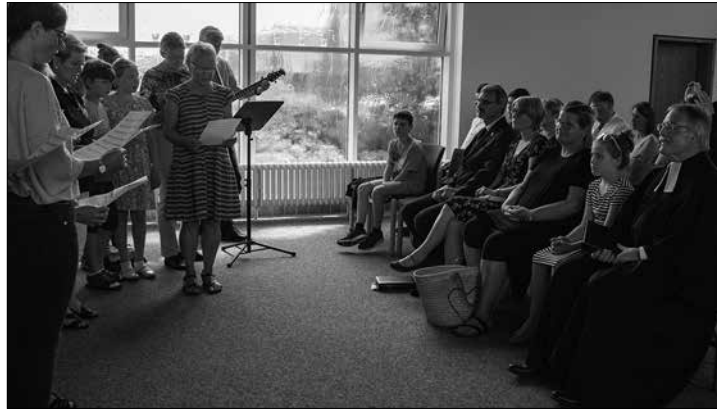
Langjährige Mitstreiter und Freunde sangen der Pastorenfamilie Weinmann zum Abschluss des Verabschiedungsgottesdienstes ein Lied.

B. Fröhlich, Podologin, im Thalasso-Hotel Nordseehaus, Bülowallee 6, 0176-62552295