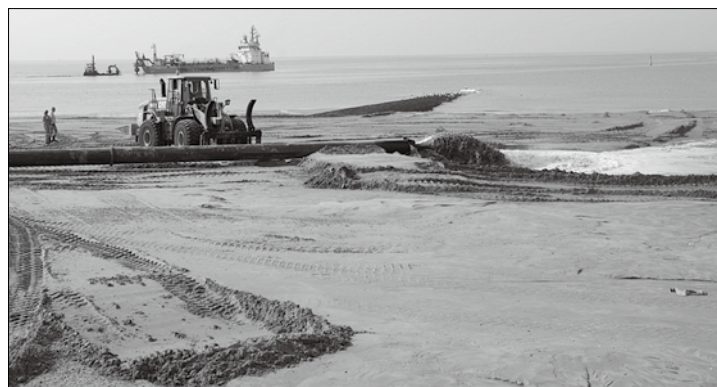
Die letzte von bisher zwölf durchgeführten Strandaufspülungen fand im Jahr 2012 statt.

Während der Arbeiten werde die Promenade nicht beeinflusst. Der Strand vor dem Deckwerk werde allerdings aus Sicherheitsgründen während der Aufspülung nur eingeschränkt begehbar sein.