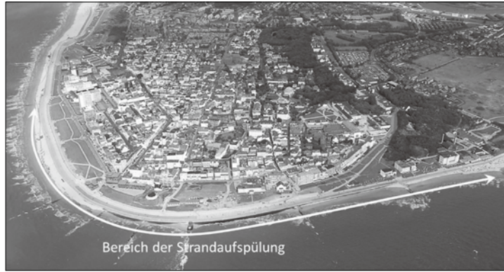
Die Vorbereitungen für die Strandaufspülungen am Westkopf werden voraussichtlich Ende Juli beginnen.

Norderney/ape – Norderneys Strände sind nicht nur für den Tourismus wichtig, sondern gelten auch als ein wichtiger Garant für einen effektiven Inselschutz. Der Sand bewahre die Bühnen und das Deckwerke vor Unterspülung, heißt es in einer Pressemitteilung des Niedersächsischen Landesbetriebs für Wasserwirtschaft, Küsten- und Naturschutz (NLWKN). Untersuchungen hätten nun gezeigt, das Strandniveau habe vor allem am Westkopf der Insel deutlich abgenommen. Der Landesbetrieb werde deshalb noch in diesem Sommer rund 160.000 Kubikmeter Sand aufspülen, um die Küstenschutzanlagen zu sichern. Für die Umsetzung der Gemeinschaftsaufgabe des Bundes und der Länder sind insgesamt rund zwei Millionen Euro eingeplant. Nach dem Winterhalbjahr durchgeführte umfangreiche Vermessungen des Strand- und Vorstrandbereichs hätten ergeben, dass insbesondere in dem rund 1,3 Kilometer langen Abschnitt zwischen den Bühnen F im Bereich des Westbades und E1 an der Kaiserwiese ein sehr niedriges Strandniveau vorliege, heißt es weiter. Dies habe sich bereits in den letzten Jahren schon angedeutet und sei somit vorhersehbar gewesen, so die Erklärung von Leiter der Betriebsstelle Norden-Norderney des NLWKN Professor Frank Thorenz. Ein deutlich abnehmendes Strandniveau gefährde allerdings die gesamten Küstenschutzanlage. Weil am Westkopf von Norderney auf natürliche Weise nicht genügend Sand ankomme, müssten die Strände regelmäßig durch künstliche Zufuhr von Sand aufgespült werden.