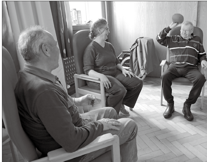
Beim Herrengedeck sind die Männer (fast) unter sich.

(syk) – „Trink, trink Brüderlein trink“ – mit diesem Lied begann der vergangene Männernachmittag des „Herrengedecks“. An den Nachmittagen wird der Spaß großgeschrieben und so wird gescherzt, gelacht und gesungen. Passend zum Namen der Gruppe schnacken die Senioren mit einem Glas alkoholfreiem Bier in der Hand über Dit und Dat und diskutieren über die Themen in den aktuellen Inselzeitungen. Dabei kommen Fußball, Politik, Inselgeschichten und Erinnerungen an früher nicht zu kurz. Und so ganz nebenbei wird auch noch ein wenig Gedächtnistraining gemacht, denn der ein oder andere Mann hat noch eine Ge-