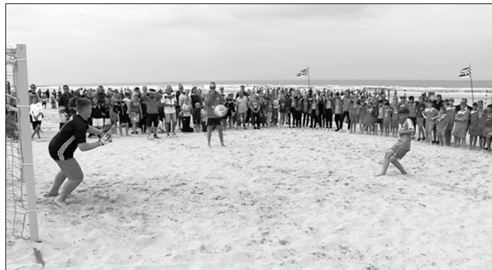
Rund 1.000 Kinder werden am Wochenende um den Pokal des Beachsoccer-Junior-Fun-Cups spielen.

(syk) – Nur noch wenige Tage sind es bis zum diesjährigen Stadtwerke-Beachsoccer-Junior-Fun-Cup. Ab Freitag werden sich rund 1.000 Kinder und 600 Betreuer und Eltern aus knapp 100 Mannschaften am Strand der weißen Düne tummeln. Das seien 300 mehr als im vergangenen Jahr, so Manfred Hahnen, der Vorsitzende des TuS Norderney, der Veranstalter des Turniers ist. Die Verpflegung von so vielen Leuten werde eine Herausforderung werden.