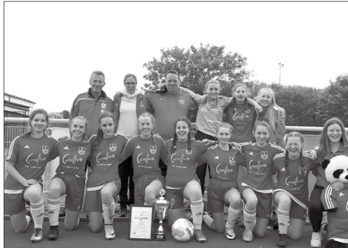
Die Norderneyer TUS-B-Juniorinnen holten sich in ihrer Klasse den Pokal.