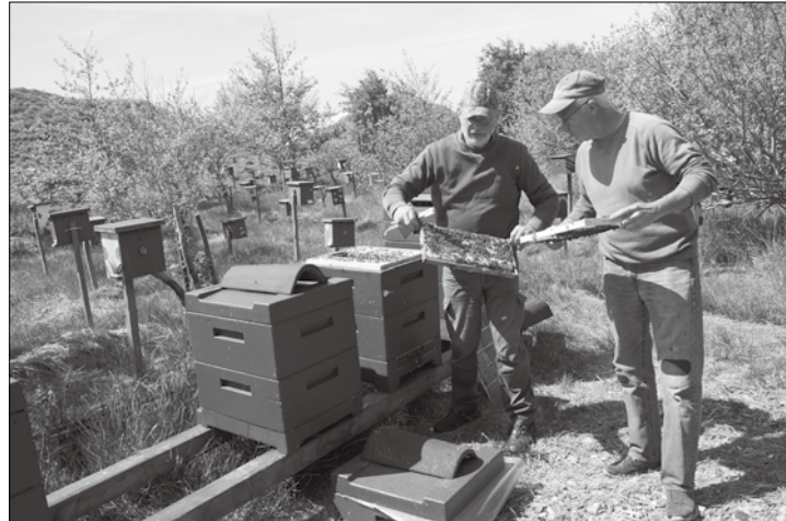
Bei den Bienenvölkern der Varroatoleranzbelegstelle herrscht schon jetzt Hochbetrieb.