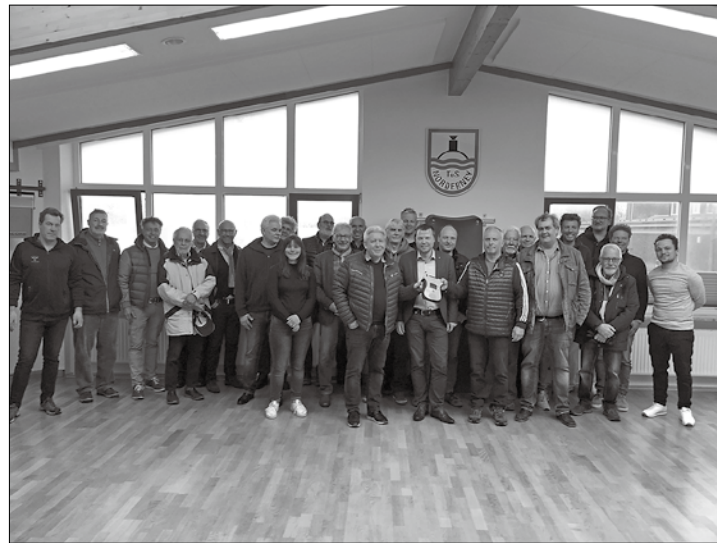
Der Rotary Club Norderney sowie einige Gäste des Clubs und der TuS-Vorstand bei der Übergabe eines Defibrillators an den TuS Norderney

Norderney/ape – Die Mitglieder des Norderneyer Rotary-Clubs übergaben nun auch offiziell einen Defibrillator an den Vorstand des Turn- und Sportvereins. Finanziert wurde das medizinische Rettungsgerät aus dem Erlös des Rotary-Adventskalenders vom vergangenen Jahr. Es ist damit das zweite Gerät bei den Sportanlagen wie der TuS-Vorsitzende