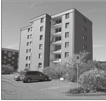
Ab der nächsten Woche werden die Wintergärten montiert.