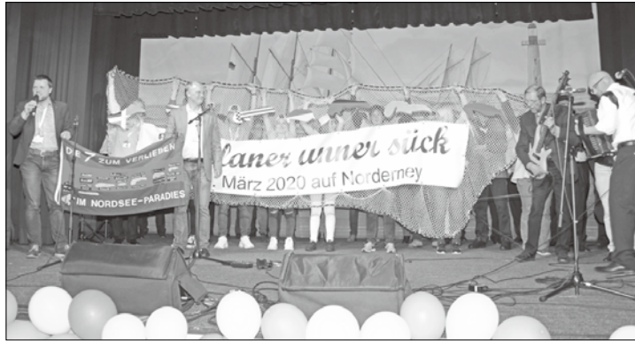
Die Norderneyer nahmen auf Baltrum die Flagge der „Sieben zum Verlieben“ im Empfang.