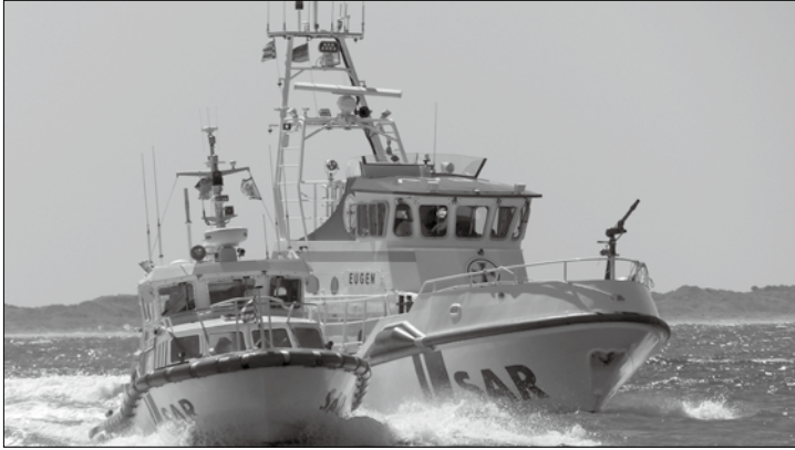
Die Eugen und die Wilma Sikorski stellen sich heute bei moderierten Manöverfahrten vor.

Norderney – Die Mitglieder der Deutschen Gesellschaft zur Rettung Schiffbrüchiger (DGzRS) laden heute von 14 bis 16 Uhr alle Einwohner und Gäste zu einem Werbetag in den historischen Rettungsschuppen am Weststrand. Die Ehrenamtlichen präsentieren aus diesem