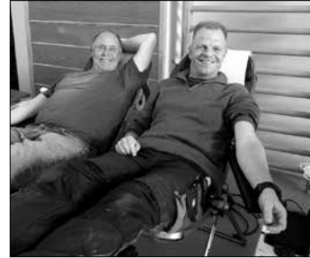
Es lief auch bei den Spendern gut - im wahrsten Sinne des Wortes.

Die nächste Blutspende findet am 17. Juli ebenfalls in der Turnhalle der Grundschule statt.