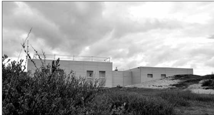
Im Mai 2017 wehte der Richtkranz über dem neuen Gebäude am Jugendzeltplatz. Jetzt soll ein weiteres entstehen.

(der) - Erst im Mai 2017 hatte Landrat Harm-Uwe Weber (SPD) beim Richtfest des erneuerten Versorgungsgebäudes am Jugendzeltplatz des Landkreises Aurich am Dünen sender betont, dass alles innerhalb des Bestandes gebaut worden sei. Denn das ist die Bedingung, um im Außenbereich Gebäude zu erneuern.