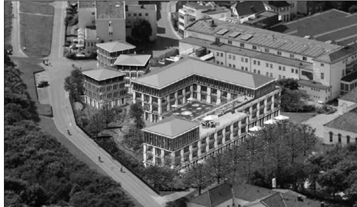
Visualisierung aus der Vogelperspektive. Das Grand-Beach-Resort mit seinen drei „Strandvillen“. Grafik: Brune/Wessels

(der) – Am Montagvormittag platzte im Norderneyer Rathaus die Bombe. Zu diesem Zeitpunkt wurde der Stadt Norderney mitgeteilt, dass sich die Bietergemeinschaft Brune Wessels aus dem geplanten Bau eines 5-Sterne-Hotels am Norderneyer Kurplatz zurückzieht.