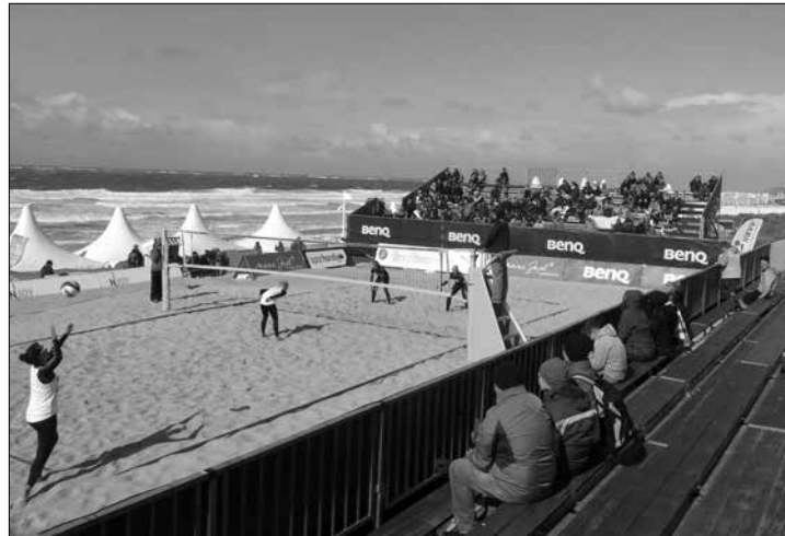
Die Beachvolleyballer spielen um 7.500 Euro Preisgeld.

(syk) – An diesem Wochenende findet zum 20. Mal das White Sands Festival auf Norderney statt. Der Veranstalter, König Event Marketing, bietet den Festivalbesuchern jede Menge Aktionen an Land und zu Wasser. Die sportlichen Wettkämpfe finden rund um den Januskopf am Nordstrand statt.