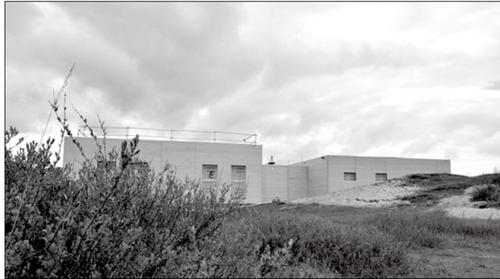
Am Dienstag wehte der Richtkranz über dem neuen Gebäude am Jugendzeltplatz.

(ape) – Nach dem vollständige Abriss der maroden Versorgungsgebäude auf dem Zeltplatz am Dünenender krönt seit Dienstag der Richtkranz die beiden Versorgungsgebäude.