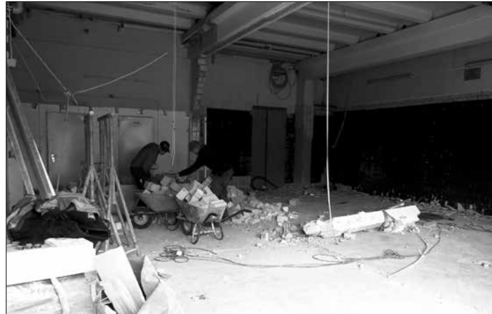
Im Feuerwehrgerätehaus wurde die Wand zwischen der ehemaligen Atemschutzwerkstatt und der Fahrzeughalle eingerissen.

(syk) – Der zweite Bauabschnitt am Feuerwehrgerätehaus hat begonnen und es hat sich schon einiges getan. So wurde die Wand zwischen der ehemaligen Atemschutzwerkstatt und der Fahrzeughalle eingerissen. Die geplanten Maßnahmen sind umfangreich, da das Gebäude aus den 70er Jahren ist. Es werden nicht nur neue Tore installiert, sondern auch der Fußboden, die Sanitäreanlagen, Heizung und Elektroanlage erneuert, so Bauleiter Carsten Rass von den Technischen Diensten Norderney (TDN).