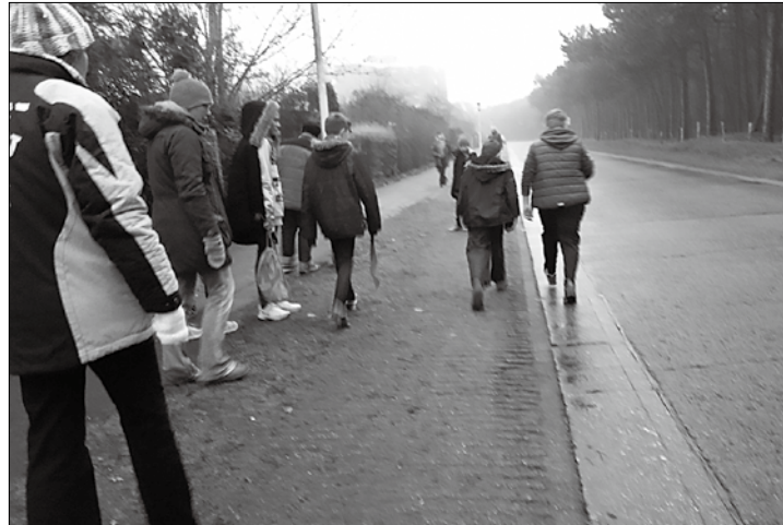
Die fünf Jugendboßelteams verabschieden sich in die Winterpause. Am 13. Januar starten die Mädchen und Jungen in die Rückrunde.

Bericht zum Boßelspieltag von Saskia-Mae Hildebrandt von Lüttje Blauwal