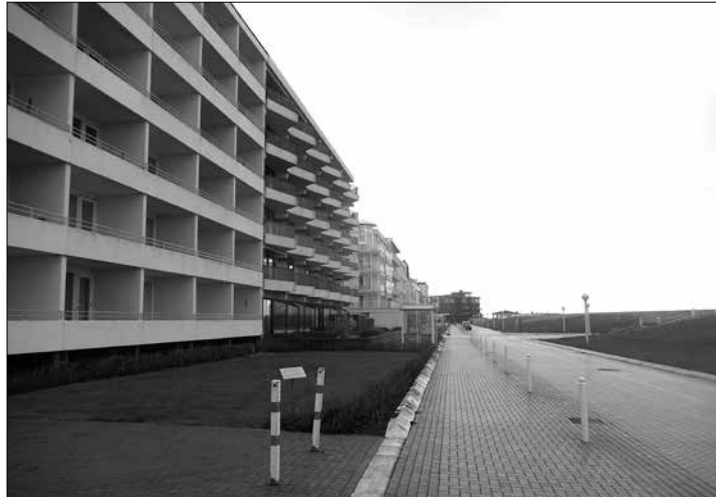
Die Stadt ist Eigentümerin eines Geländestreifens vor den Häusern der Kaiserstraße. Kaufinteresse gibt es bislang nur vereinzelt.

(der) – Mitunter sind es die kleinen Nebengeschichten, die eine Ratssitzung so richtig interessant machen.