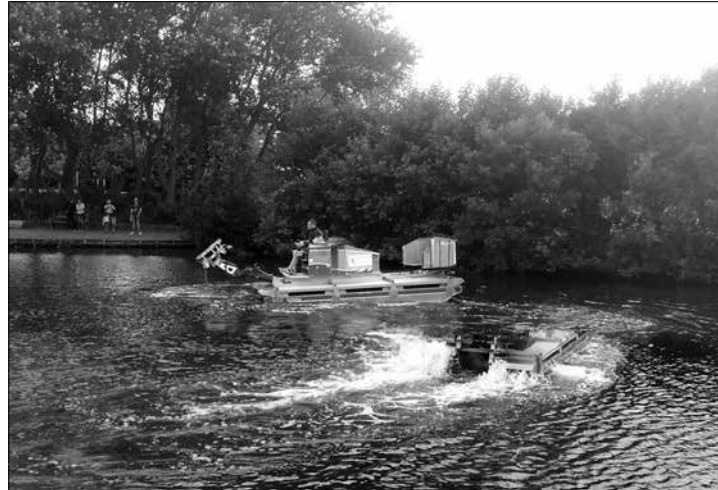
Mithilfe eines Amphibienfahrzeugs soll der Schlamm aus dem Polderteich herausgepumpt werden.

(syk) – Eine Maßnahme, die von den technischen Diensten (TDN) im nächsten Jahr mitbetreut wird, ist die Entschlammung des Polderteichs. Dies teilte der Leiter der TDN, Erik Fischer auf der letzten Betriebsausschusssitzung mit.