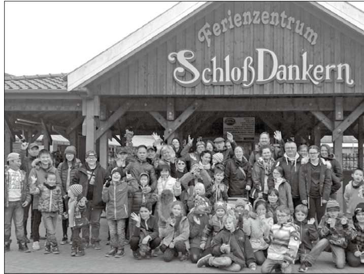
Zweimal ging es mit der Arbeiterwohlfahrt in diesem Jahr zu Schloss Dankern.