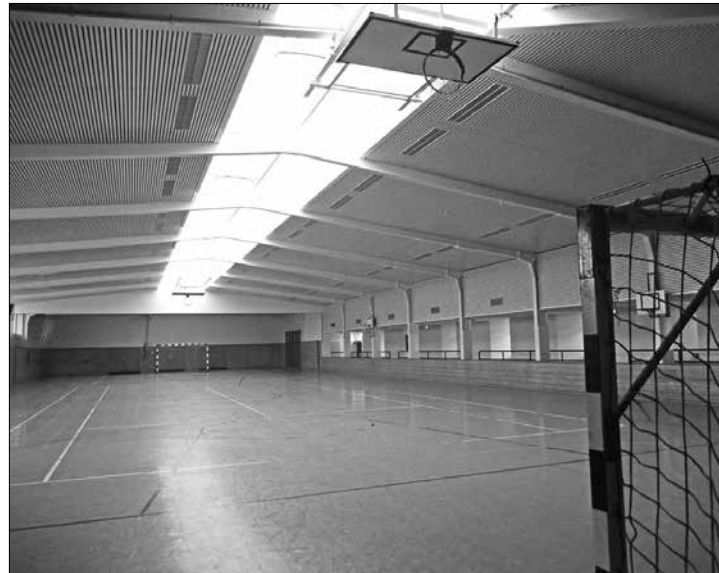
Es riecht noch nach frischer Farbe, aber der Spielbetrieb in der Sporthalle an der Mühle kann wieder beginnen.

(der) – Seit gestern ist die Sporthalle an der Mühle offiziell wieder hergestellt. Gerade noch rechtzeitig für den Beginn der Heimspiele der TuS Damen, die am kommenden Sonntag spielen (Damen I um 13.45, Damen II 15.45 Uhr), konnten die letzten Arbeiten abgeschlossen werden. Ursprünglich waren die Arbeiten in wesentlich kleinerem Umfang geplant gewesen. Die Stadt war aber vom Landkreis aufgefordert worden sämtliche Hallendächer mit Blick auf den Zustand und die Stabilität zu überprüfen.