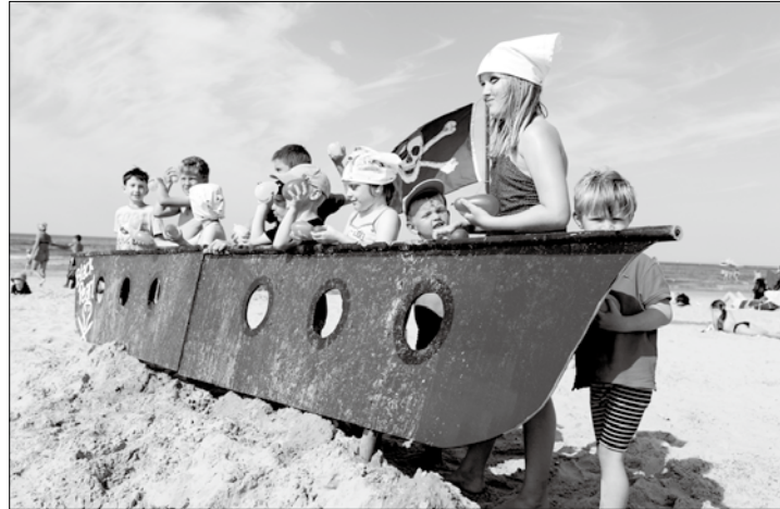
Am Samstag und Sonntag begeben sich die Kinder am Weststrand in eine Piratenwelt.

Norderney – Am Wochenen- de verwandelt sich der West- strand zu einer Piratenhoch- burg. Die Kinder verkleiden sich als Seeräuber und bege- ben sich mit dem berühmten Seeräuber Käpt'n Hinfefuß auf die Reise in die Piraten- welt. Von Kanonentraining über eine Piraten-Olympiade bis hin zu einer Seeschlacht, wird es am Samstag und Sonntag jeweils von 11 bis 18 Uhr zahlreiche Erlebnisse für Groß und Klein geben. Ab 18 Uhr lädt der Norder- neyer Kletter- & Erlebnispark alle Seeräuber zur Piraten- disco ein. Die Band „Piraten Sound Control“ bringt Kin- der bis 12 Jahre zum Hüpfen, Tanzen und Singen.