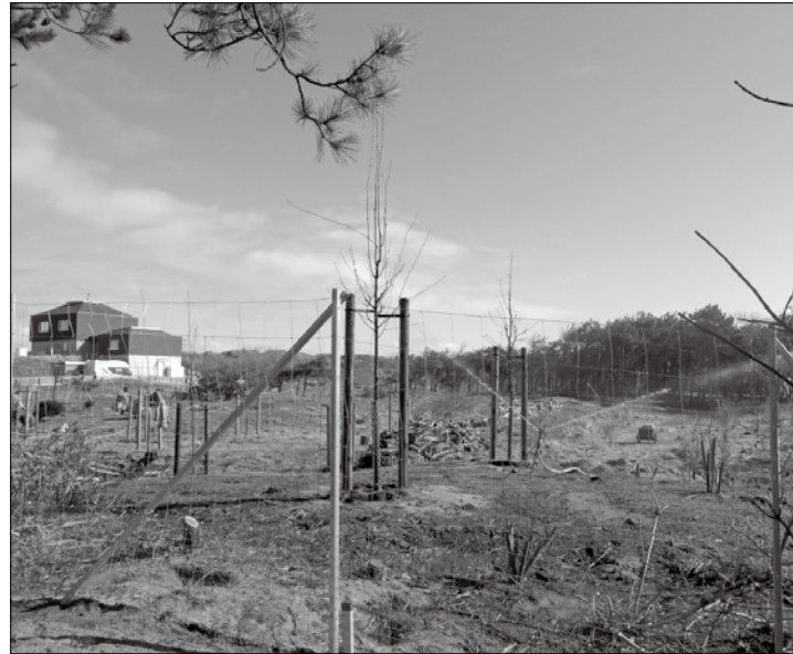
Die ersten Bäume stehen und die Bewässerungsanlage wurde von den TDN-Mitarbeitern installiert und in Betrieb genommen.

(syk) – Die Aufforstung des ehemaligen Waldes hinter der Wetterwarte steht kurz vor dem Abschluss.