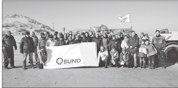
Mit Genehmigung des Nationalparks sammelten 40 Teilnehmer zwei Tonnen Müll an den Stränden und Salzwiesen.