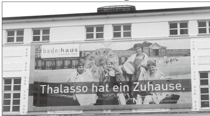
Bekommt Thalasso womöglich bald ein anderes Zuhause?

(der) – Der vielfach auf Norderney verwendete Begriff „Thalasso“ ist möglicherweise urheberrechtlich geschützt und darf von Norderney nicht verwendet werden. Das wurde am Donnerstag am Rande eines Gespräches bekannt. Der Begriff wurde von einer anderen norddeutschen Insel beim Patent- und Markenamt als Marke angemeldet. Ähnlich wie Norderney erging es 2011 der Insel Helgoland. Die hatte bis dahin mit dem Motto „Meine Insel“ geworben, jedoch war der Markenschutz 2005 abgelau-