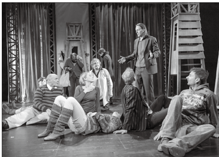
Das Theaterstück „Wie im Himmel“ war 2015 neben „Harry und Sally“ das bestbesuchte Stück auf Norderney.

Überlegungen, aus dem Zweckverband auszutreten, habe es vor Jahren einmal in Weener gegeben. Daraufhin hat sich dort ein Freundeskreis gegründet. Die Aktiven sind von Haus zu Haus gelaufen und haben Abonnenten akquiriert. Der Einsatz hat sich gelohnt. Heute ist Weener mit einer Auslastung von über 98 Prozent einsamer Spitzenreiter innerhalb des Zweckverbands, berichtet Düwel.