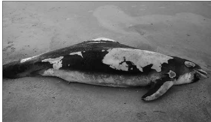
Zurzeit werden auffällig viele tote Wale und Delfine an der Nordsee angespült. Genaue Ursachen sind unbekannt.

Norderney – In den vergangenen zwei Wochen strandeten an der deutschen und niederländischen Nordseeküste zwölf Pottwale. Außerdem wurde von Borkum Anfang des Jahres die Strandung eines „Gemeinen Delfins“ gemeldet. Auch auf Norderney ist ein Meeressäuger am Strand gefunden worden. Der Norderneyer Klaus Jentsch entdeckte am zweiten Weihnachtsfeiertag am Nordstrand einen toten, etwa drei Meter langen Weißschnauzendelfin.