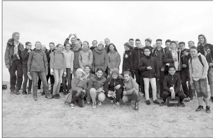
Die Gruppe Achtklässler sammelte 830 Kilogramm Müll im Inselosten.