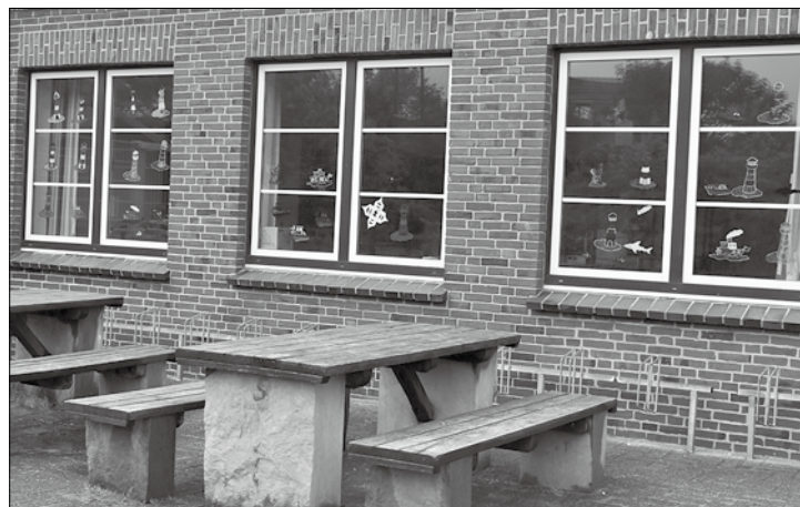
Außenansicht der neuen Cafeteria der Grundschule, die nach den Sommerferien in Betrieb gehen soll.