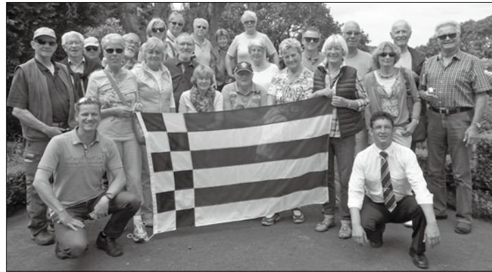
Gruppenreisen haben auf Norderney Tradition.