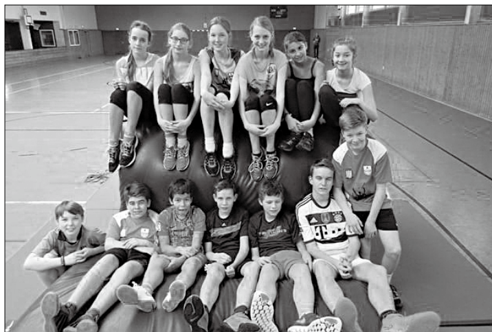
Auch Schülerinnen und Schüler der KGS nahmen am Ferienprogramm des TuS Norderney teil.

(ape) – Zwei Wochen Sport gab es für rund 35 Norderneyer Schüler beim Ferienprogramm des TuS Norderney. Der Sportverein bietet bereits zum zweiten Mal den Feriensport für Norderneyer Schüler an. Wer denkt, für die Kinder gab es 14 Tage nur Gymnastik, liegt falsch. Auf dem Plan stand der Spaß an der Bewegung an erster Stel-