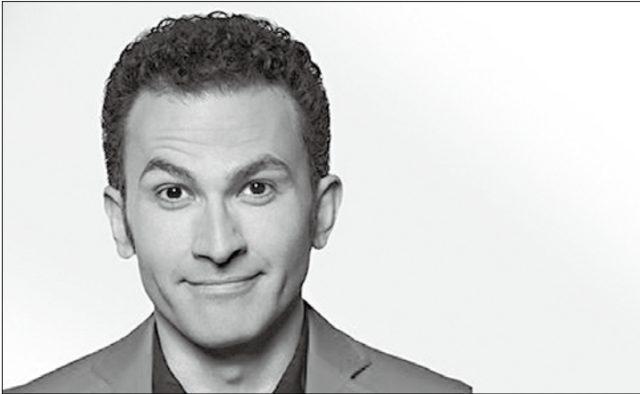
Der Ethno-Satiriker Fatih Çevikkollu tritt am Montag im Conversationshaus auf.

Am kommenden Montag um 20 Uhr im Conversationshaus ist „FatihTag“. Der Eintritt: kostet 21 Euro (Abendkasse 23 Euro). Vorgestellt wird das neue Programm von Fatih Çevikkollu. „FatihTag“ ist ein Tag mit Fatih in dem Land, in dem die Post abgeht: postmodern, postmigrantisch und postdemokratisch. Die Welt befindet sich im Wandel und die Gesellschaft wird umgebaut.