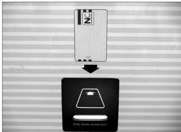
Das Einnahmepius aus der Kurtaxe liegt gegenüber dem Vorjahr bei 3,56 Prozent.

(ape) – Es gibt einen klaren Trend nach oben. Das zeigen die Zahlen der Kurverwaltung. Im letzten Jahr machten mehr Menschen auf Norderney Urlaub. Im letzten Jahr besuchten knapp 513.000 Menschen die Insel. Unter dem Strich steht damit ein Plus von 4,1 Prozent allein für das letzte Jahr. Schon in den Vorjahren gab es Zuwächse in dieser Größenordnung. Dieses Plus komme auch dadurch zustande, dass die Zeiten außerhalb der Hauptsaison etwas stärker angefragt werden. „Wir bewerben auch außerhalb der Saison. Es hilft ja nicht die Betten im Sommer drei- oder viermal zu vermieten“, kommentiert Kurdirektor Wilhelm Loth das Ergebnis.