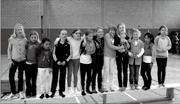
Großer Spannung bei den Mädchen.