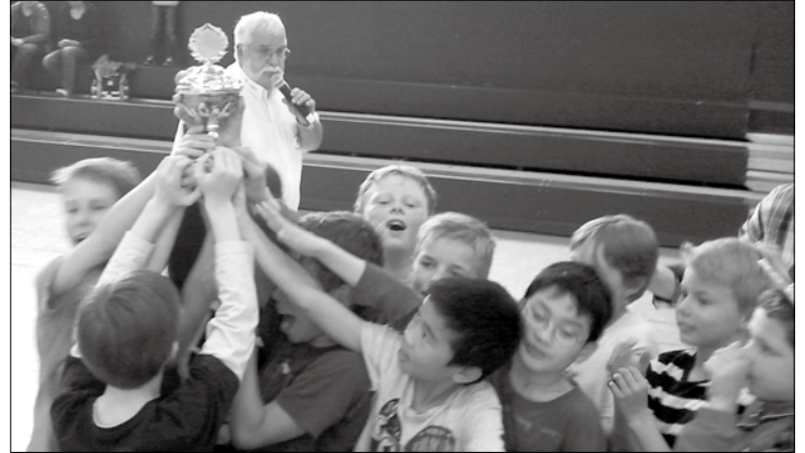
Großer Jubel bei den Jungs.