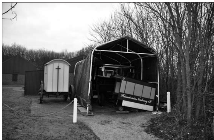
Der historische Pferdeomnibus (unter der Plane im Hintergrund), der erst vor drei Jahren aufwändig restauriert wurde, benötigt einige Reparaturen und einen geeigneten Unterstand.

(bad) – Sturmtief „Christian“ hat die Insel arg gebeutelt. Erst gestern berichteten wir über den aktuellen Stand der Aufräumarbeiten.