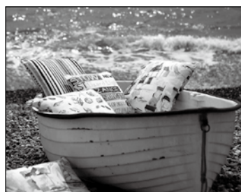
Polsterei Gardinen Plissees