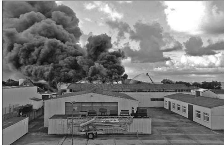
Die Flammen schlagen aus dem Dach, die Rauchwolke ist bis zum Festland zu sehen: die Bus-Halle Tjaden im Gewerbegebiet ist gestern abgebrannt.

(bad) – Ein Brand in der Halle Tjaden im Gewerbegebiet machte gestern Morgen einen Großeinsatz der Feuerwehr nötig. Begleitet wurde der Brand, dessen Ursache zum Redaktionsschluss noch nicht bekannt war, durch weithin hörbare Explosionsgeräusche.