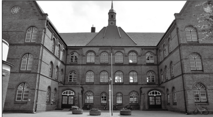
Der Rat der Stadt beschäftigt sich am Donnerstag nächster Woche mit der Nachmittagsbetreuung in der Grundschule.

Norderney – Der Rat der Stadt Norderney entscheidet voraussichtlich in seiner nächsten Sitzung am 6. August über die Nachmittagsbetreuung der Norderneyer Grundschüler. Die Sitzungsvorlage der Verwaltung empfiehlt einen Elternbeitrag von 110 Euro pro Monat. In diesem Beitrag sind die Kosten für das Mittagessen in der KGS noch nicht enthalten. Die Übernahme des Angebotes durch die Stadt wird nötig, da die bisherige Anbieterin aus privaten Gründen aufhört. Das Betreuungsangebot soll sich am bisherigen Rahmen orientieren. Das bedeutet, dass eine Gruppe mit 20 Kindern von zwei Kräften montags bis freitags von 12.30