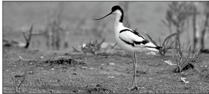
Sábelschnäbler wie dieser brüten auch auf Norderney.