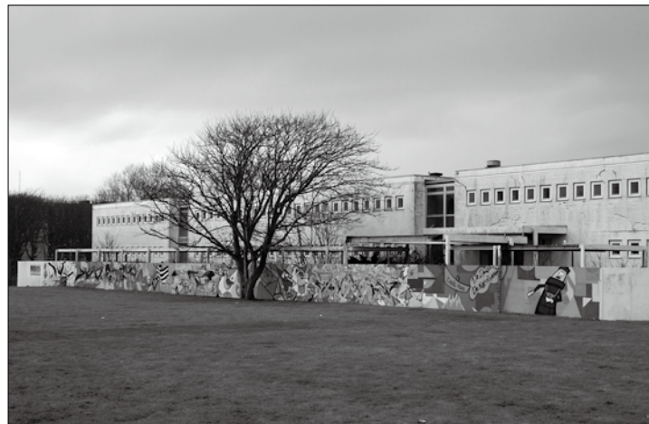
Hier soll ein „hochwertiges Hotel“ entstehen.

(der) – Zehn Jahre ist es her, dass das ehemalige Niedersächsische Staatsbad kommunalisiert wurde. Seitdem trägt die Kurverwaltung zwar noch den Titel Staatsbad im Namen, gehört aber zu 100 Prozent der Stadt Norderney. Mit der Kommunalisierung ging einher, dass die Kurverwaltung vom Land Niedersachsen mit Geld ausgestattet wurde, um den Investitionsstau zu beseitigen.