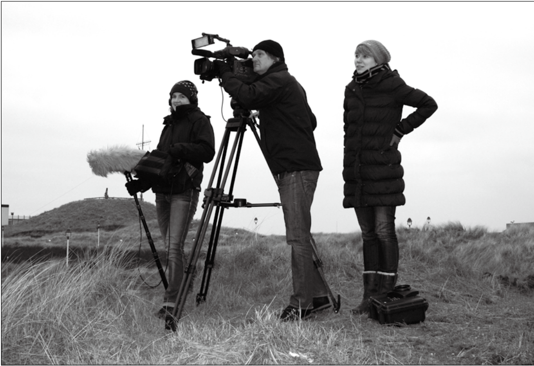
Das NDR-Fernsehen war gestern auf Norderney zu Gast.