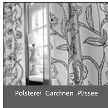
Polsterei Gardinen Plissee