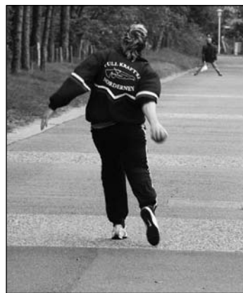
Die Klootschießer von Vull Kraft 82 stehen an der Tabellenspitze.