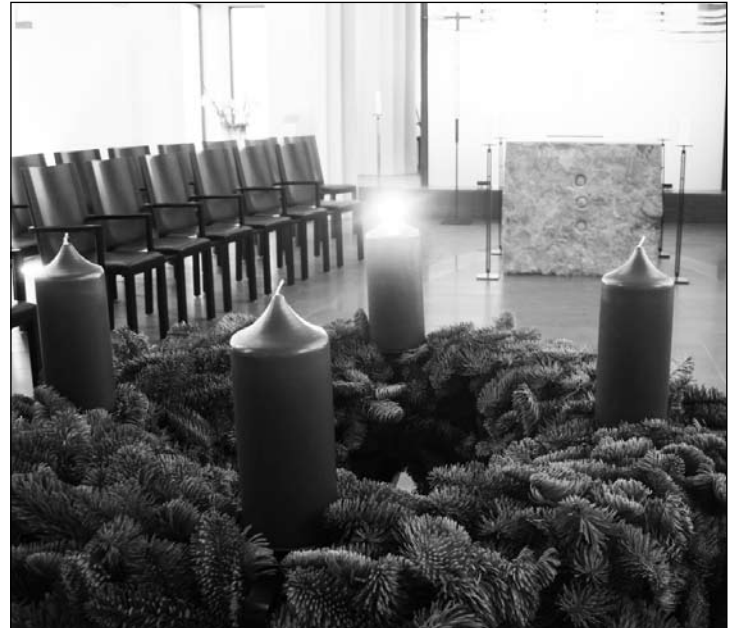
Adventsstimmung in der katholischen Pfarrkirche.