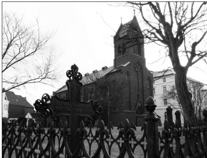
Blick vom alten Friedhof auf die evangelische Inselkirche.